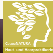
Fachreferentin der Module Haut- und Haarpflege, CULUMNATURA® Pflanzenhaarfarbe und Kopfmassage

befreit von gereizter Haut, Rötungen und Pickelchen nach der Rasur und freut sich jedes Mal über ein frisches und weiches Hautgefühl. Zudem ist es wunderbar sich und der Umwelt mit konsequenter NATURkosmetik etwas Gutes zu tun.